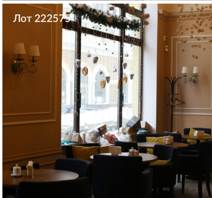
Расстановка мебели 2 этаж